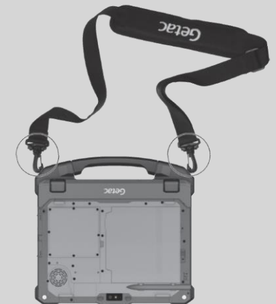
Conectado al teclado desmontable