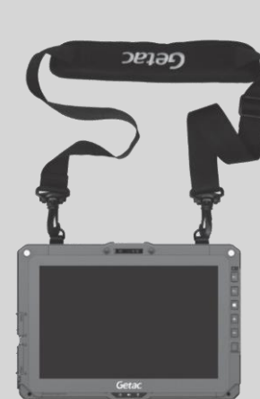
Conectado a la tableta