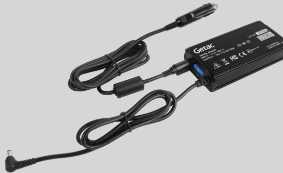
Versión para toma del encendedor