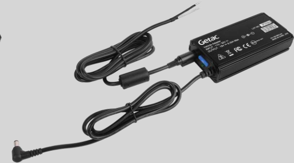
Versión con cable pelado