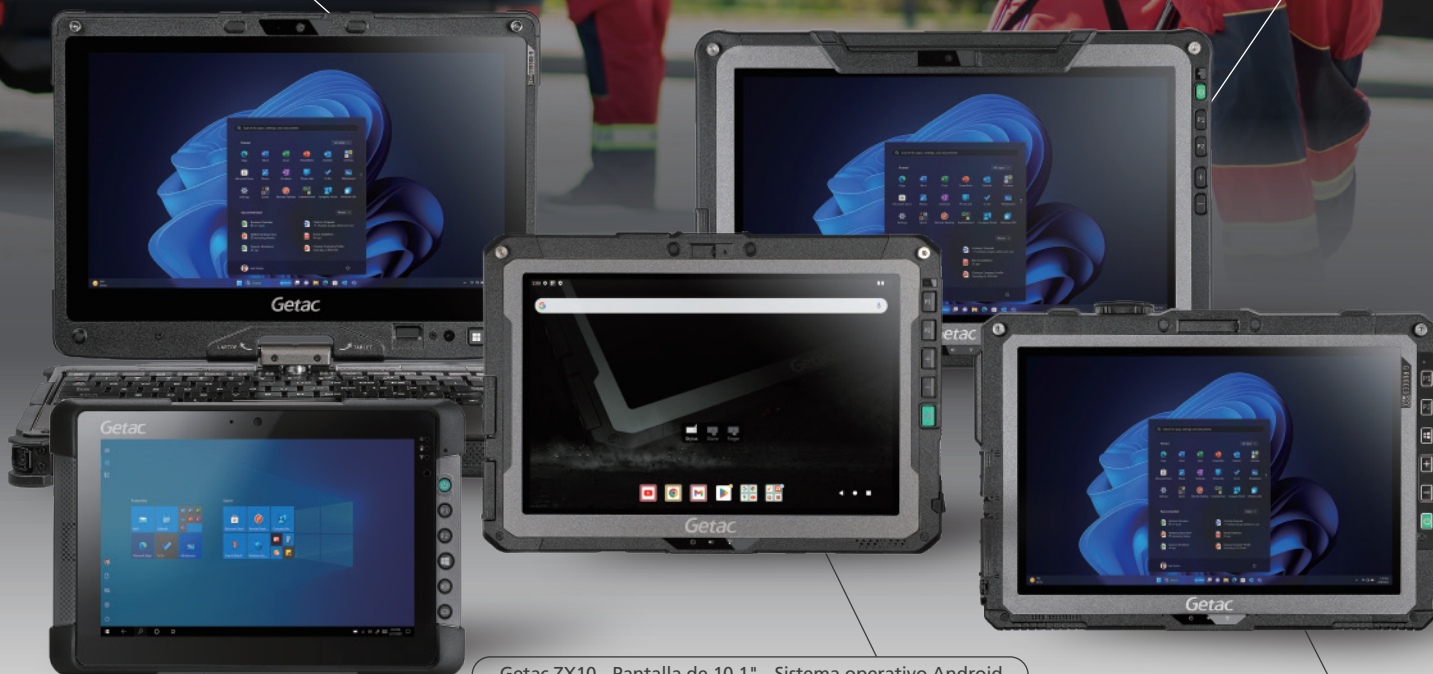
Getac ZX10 - Pantalla de 10,1" - Sistema operativo Android