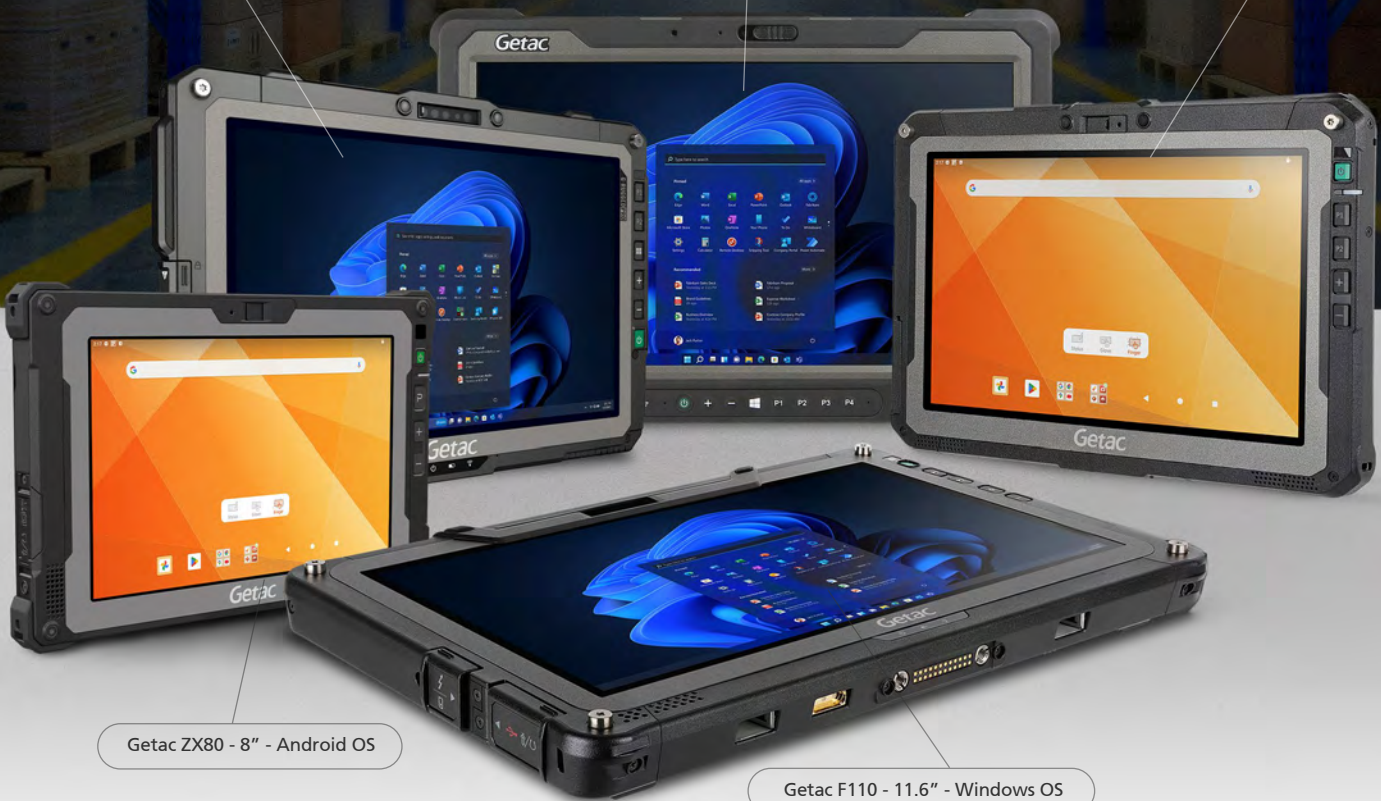
Getac ZX80 - 8" - Android OS