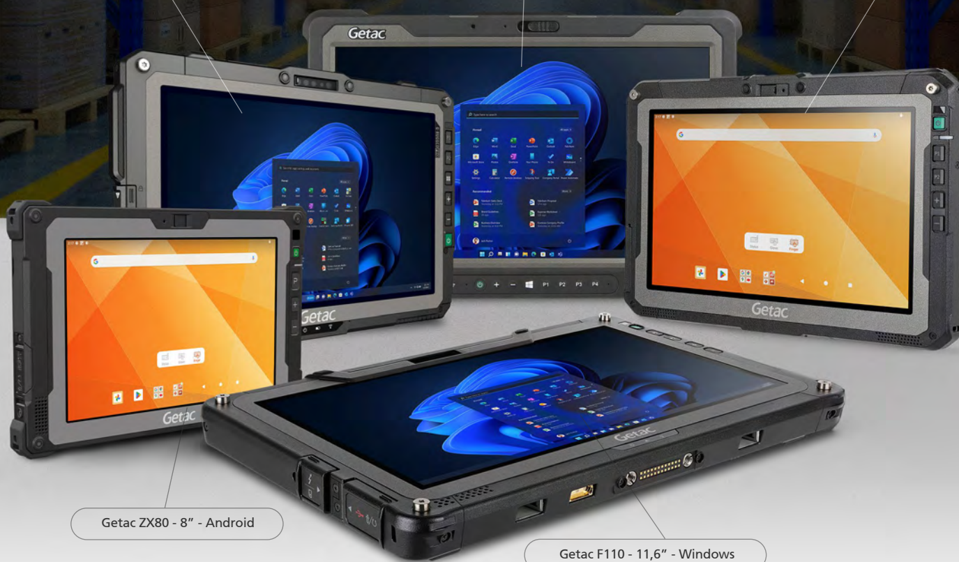
Getac ZX80 - 8" - Android