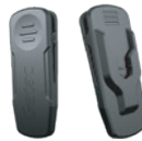
Pince crocodile Getac P/N : 541391850TM4