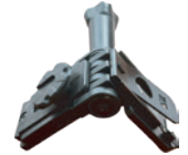
Support Pivotant Getac P/N : 541391850TM7