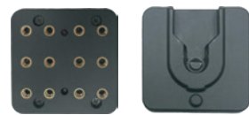
Support Universel Getac P/N : 541391850TM9

Veuillez prendre contact avec votre représentant commercial Getac local pour de plus amples informations sur notre solution renforcée d'assistance à distance.