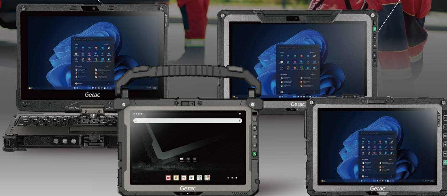
Getac ZX10G1-IP – écran de 10,1 pouces – Android